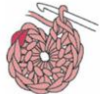
Den Boden häkeln 2