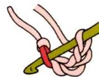
Haga un anillo de la cadeneta

Puedes continuar decorando el florero según tus preferencias, bien tejiendo una fila de un color que contraste o trenzando o anudando una hebra de forma elegante a través de los zpagetti.